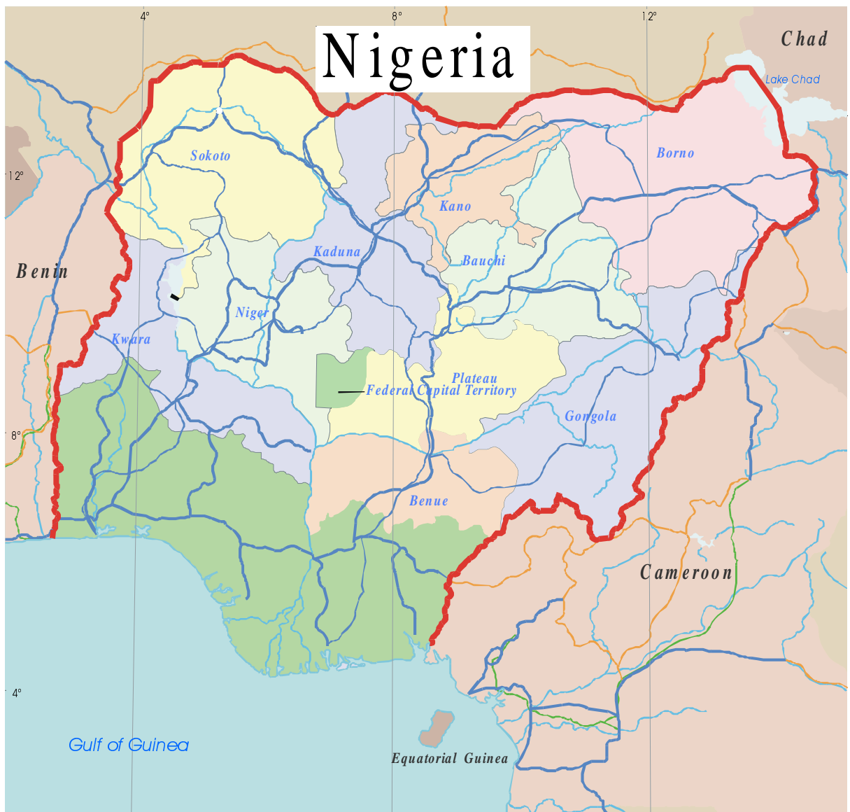
Figure 1: Carte des États où les études ont été réalisées.

1992 MAGELLAN Geographix/SMSanta Barbara, CA (800) 929-4627